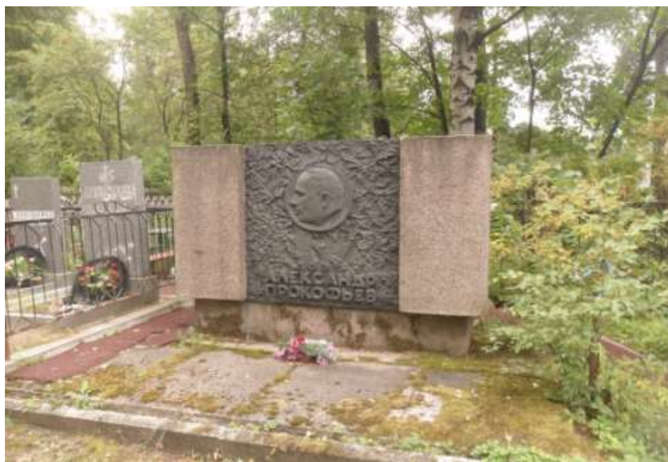
Памятник Александру Прокофьеву